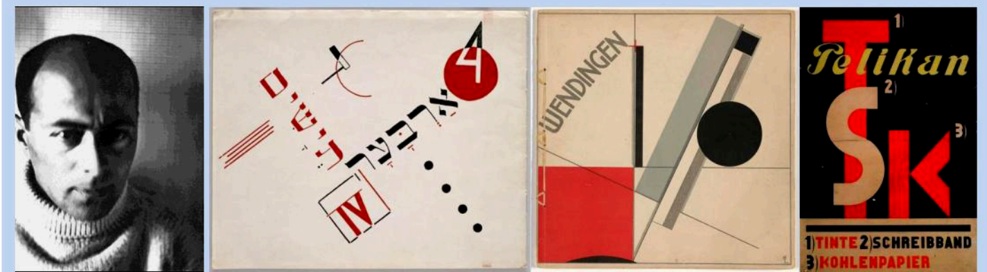
Zelfportret 1914; Teyashim, 25.3 x 20.9cm, 1922, (MOMA, New York); Omslag Wendingen 1921; Affiche Pelikan